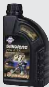
PRO 2 SX