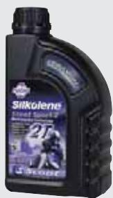
SCOOT SPORT 2