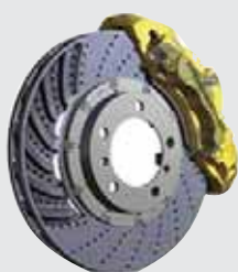
MAINTAIN DOT 4 | 5.1