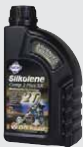
COMP 2 PLUS SX